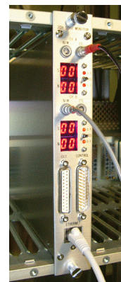
図 1: 2ch 50Hz Monitor モジュール。正しくない信号が来るとカウンタの値がひとつ増える。信号が早過ぎたか遅すぎたかで 2 つカウンタが用意されている。一番下が XPort の 100BaseTx のコネクタ。

上に挙げた方法はかなり応用範囲が広いと思われるが、データ転送能力やデータ処理能力を必要とする場合には、ボード上の CPU が直接 Ethernet と接続できることが好ましい。しかし、これまではそのようなボードを開発する環境が十分でなく、結果として開発に長い期