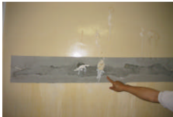
図3：工事から10ヶ月後

復を行う予定である。このとき、クラックに沿ってライン状に行うのではなく、かなり広範囲におよぶ面に補修を施す予定である。