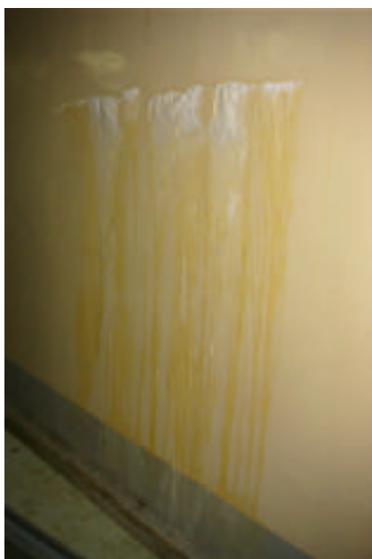
図2：漏水を伴う工事前のクラック

図2にKEKBトンネル内に生じたクラックと漏水状況（工事前）を示す。工事は、先ずクラック部に沿って深さ～30mm、幅～30mmにわたりコンクリートを除去し、そこに上記のコンセントレートに静水を加えてペースト状に練り混ぜたものを充填した。最後に触媒性化合物を水に溶かした溶液を表面に塗布した。図3に工事を施して10ヶ月後の状況を示す。施工直後に元のクラックに沿って結晶化したセメントの滲みだしがみられたものの、そのあとの漏水はなくなっていることがわかる。ただし、元のクラック部から枝分かれのような状況の新たなクラックと、小さいながらも漏水の発生が見られる。