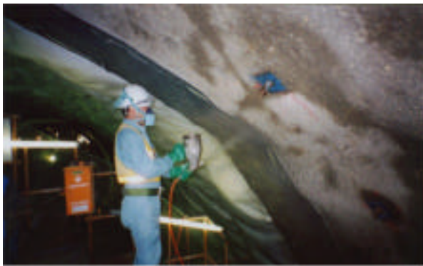
図5: 塗布吹付工の施工状況

図5はNATMにて掘削されたトンネルの瞬結吹付コンクリートによる1次覆工のあとの塗布吹付工の様子を示す。TBMにて掘削された場合は1次覆工のみの場合もある。地山によって必要な場合は2次覆工を行う。