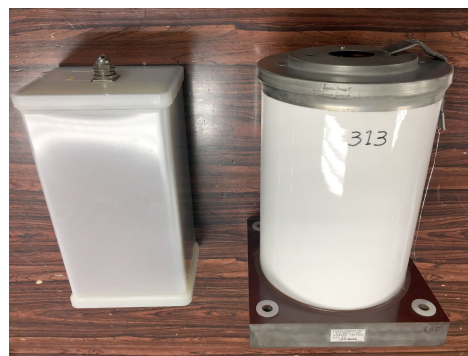
Figure 5: Capacitors of the Nextef modulator (right), and of the injector linac.

ちなみに、今回 Nextef のパルス変調器で使用されていたコンデンサは Fig. 5 (左) のようにプラスチック容器であったが、電子陽電子入射器本体において同様の目的のために 60 台、20-40 年使用されている大電力パルス変調器のコンデンサは、セラミクスと金属の容器である。また、電位傾度 (誘電体の単位厚み当たりの印加電圧) について、Nextef の 52.8 \text{ V}/\mu\text{m} に対して入射器では 43.6 \text{ V}/\mu\text{m} と安全重視で余裕を持って設計されている。さらに破裂しないように防爆装置を備えている。