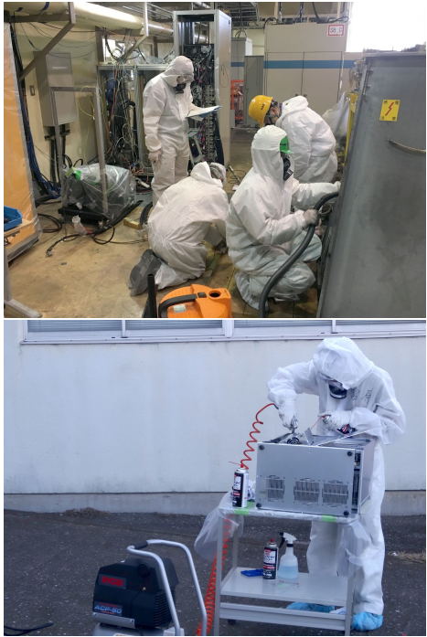
Figure 7: Intensive clean-up work continued for three weeks.

それぞれの解決に数日を要する事案も多く、毎朝全員による復旧作業進捗打ち合わせを持ち、夕方には各グループ責任者による打ち合わせを持ち、漏れがないような効率的な作業を心掛けた。また、情報交換のために、毎日 Mail による情報共有と、Web による情報集約、重要情報の入射器棟玄関での掲示を行った (Fig. 8)。