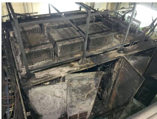
Figure 3: Burnt pulsed high-power rf modulator.