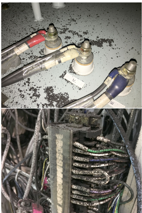
Figure 6: Carbon soot sneaked into injector components.