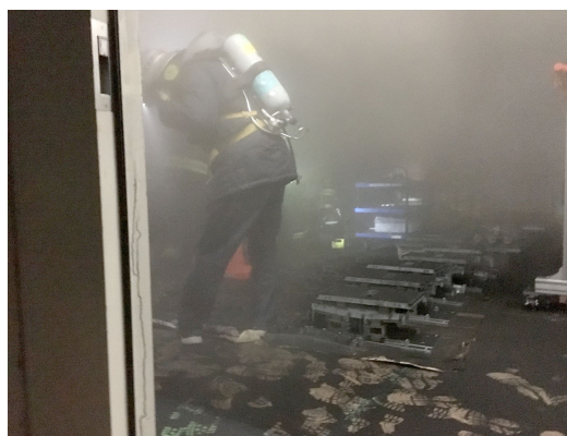
Figure 2: A fireman entering into the burnt room.

案内した。加速管準備室のシャッターが熱くなっていないことや、放射線は既に発生していないはずなどの状況検討を入射器棟東側にて行なった。その後、消防士 6 人と放射線取扱主任者である放射線科学センター長が、放射線防護や酸素マスクの対策を行った上で、23 時 15 分ごろから現場に入り、放射線や熱などの危険が無いことが確認された (Fig. 2)。