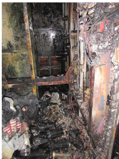
Figure 4: Space where pulse-forming network was installed and burnt.

ク容器のコンデンサが寿命により破裂し、漏れた絶縁油が高電圧放電により着火したという可能性が指摘されている。