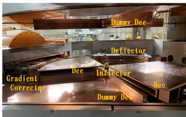
Figure 2: Components inside the AVF cyclotron are shown. After upgrade the upper yoke of magnet can be lifted in 60 cm and then maintainability is achieved.

AVF 改修工事と並行して、各種基礎研究も進められてきた。高温超電導線材のみによるスケルトンサイクロトロン設計[4]、自動サイクロトロン共鳴加速原理に基づく新しいタイプの加速器開発[5, 6]、At-211 製造用ビームスキヤニングシステムの開発[7]、サイクロトロンの高エネルギー効率化に向けた検討[8]、高強度小型サイクロトロンエネルギー効率向上を目指した要素技術開発[9]、などがそれである。