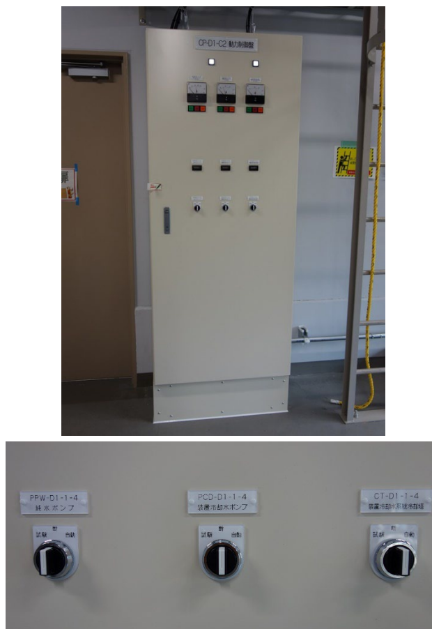
Figure 4: Power control board CP-D1-C2.