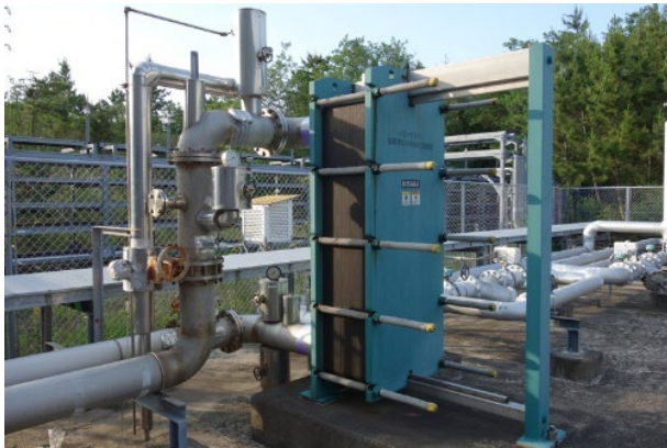
Figure 5: Heat exchanger HE-D1-1.