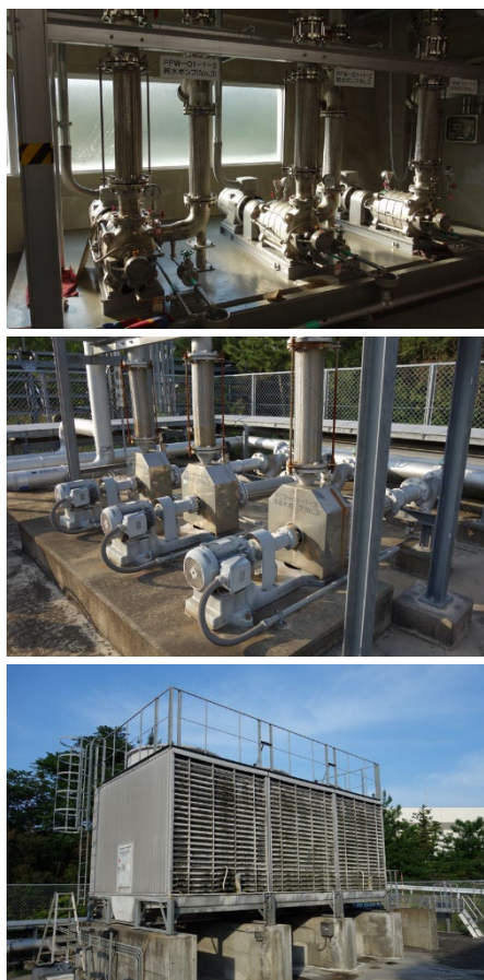
Figure 2: Pure water pumps PPW-D1-1-1~3 (upper), equipment cooling water pumps PCD-D1-1-1~3 (middle), and cooling towers CT-D1-1-1~3 (lower).

Figure 2 に第一電源棟の純水ポンプ、装置冷却水ポンプ、装置冷却水系統冷却塔を示す。純水ポンプ、装置冷却水ポンプ共、常時 2 台稼働 1 台予備の運用であり、電源盤において 3 台同時運転はそもそも出来ない仕様となっている。これに 4 台目のポンプの制御系を追加し、3 台同時稼働が可能となるような改造を加える。電気の供給容量は足りているので基幹部には手を加えず、純水ポンプ、装置冷却水ポンプの制御系を改造し、Fig. 3 の様に予備機選択スイッチに No. 4 を追加した。また、ポンプ室内に将来増設用に CP-D1-C2 動力制御盤 (Fig. 4) を新設した。ここには 4 台目の純水ポンプ PPW-D1-1-4、装置冷却水ポンプ PCD-D1-1-4、装置冷却水系統冷却塔 CT-D1-1-4 を接続することができる。