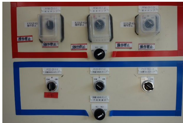
Figure 3: Modification of pump power supply pane. No.4 was added to the reserve unit selection.

ンプ 2 台運転を前提とした容量になっているため、こちらも更新する必要がある。型式 SX-415B-NP-139 から SX-415B-NP-209 への置き換えを行う。内容積のみ 165.6 L から 249.6 L にアップし、他の仕様は現状と同じである。熱交換器本体は長納期品であったため 2023 年度に本体の調達のみを行い、2024 年度のメンテナンス期間に工事を行えるよう計画した。交換工事は主電磁石通電試験と干渉しないよう、ヤード高圧停電期間中となる本年 (2024 年) 9 月 20 日までに完了する予定である。