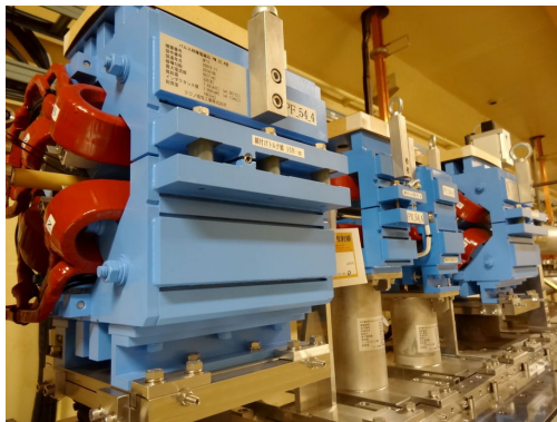
Figure 2: Example of pulsed magnets installed in the linac.

入射器内の下流部分においては、4つの蓄積リング加速器の入射エネルギーが、2.5 GeV から 7 GeV と大きく異なり、ビーム光学整合を取るためには異なるビーム収束力が必要となるため、パルス四重極電磁石の運用が重要となる。ちなみに KEKB 計画時には蓄積リングの入射条件が厳しくなかったために、入射器内では曖昧な光学条件でビーム輸送を行い、各蓄積リングへのビーム輸送路に別れてから光学整合を確立し直していた。しかし、SuperKEKB の入射光学条件の精度要求が高く、さらに航跡場の影響も避けなければならない、KEKB 時と同じ戦略を取ることはできない。