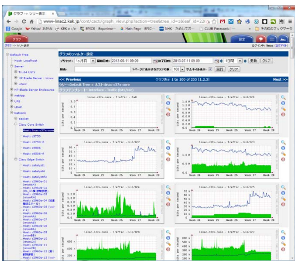
Figure 2: Display of Cacti

ネットワークを正常に運用することは、加速器の安定なビーム運転において不可欠である。これまで入射器では、ネットワークの安定運用のため、SNMP (Simple Network Management Protocol) を用いてネットワークのトラフィック状況や機器の負荷状況を MRTG (Multi Router Traffic Grapher) [1] と呼ばれるツールで監視していた。MRTG は、ネットワークのトラフィック状況を示すグラフィメージを含む HTML ページを生成するツールであり、Web 上からもネットワークの状況を監視することが可能である。しかしながら、ネットワーク接続機器の増加にともなう通信量の増大のため、MRTG のデータ更新に遅延が見られるようになってきた。このため、MRTG の代替として、Cacti [2] と呼ばれる監視ツールの導入をおこなった。Cacti は、MRTG と同様に SNMP を利用したグラフツールであるが、MRTG よりも高機能なグラフツール (RRDTool) が使用可能である。当該機能により、グラフデータの保存およびグラフ生成が容易に実現可能である。さらに、過去のグラフデータを参照する、あるいはメーカー独自の SNMP 情報の利用も簡便であることが利点としてあげられる。