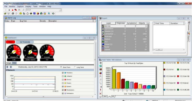
Figure 3: Display of Sniffer portable

他の解析ツールとして、WireShark [3] と呼ばれるフリーソフトウェアのパケットモニターも利用している。WireShark は、Unix, Linux, Mac, Windows など多くのプラットフォームで動作し、また多くのプロトコルを解析することができる。しかしながら、EPICS で用いられる CA プロトコルは標準ではないため、スロベニア、アメリカ、KEK の三者で WireShark のプラグインを共同開発し、CA プロトコルの解析が可能となった [4] 。