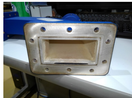
Figure 5: Photograph of the damage on the waveguide due to RF induced breakdown.

進行波加速管へ高周波電力を供給する導波管内での放電が 2019 年 11 月に顕在化し、運転に支障をきたす様になった。放電箇所特定のため、市販のセキュリティ向け高性能集音マイク(LPS-TM101)を 2 つ用意し、導波管に貼り付け、放電発生時のマイクの信号時間差を利用して、放電箇所が H-Bend 導波管であると特定した。H-Bend 導波管を取り外すと、Fig. 5 の様に導波管端面に黒い放電痕があった。導波管端面で放電していた様である。放電箇所を研磨し、ガスケットを交換して元に戻したところ、放電が収まった。