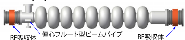
図2: 主リニアック用9セル空洞の基本設計。

まずTESLA空洞から形状を変更した空洞中央部のセルを試験するための単セル空洞 (C-single) と、偏心フルートを含む複雑なビームパイプ構造が付属した単セル空洞 (E-single) の2台を試作し、縦測定試験を行った [12]。その結果、どちらの空洞でもERLで要求される20 MV/mの加速電界において、 10^{10} 以上の無負荷Q値 (温度2 K) を達成出来た。次に9セル空洞の試作を行い、一連の表面処理工程を終えて、縦測定の準備を行っている (図3)。主リニアック用空洞の開発状況については [13] で詳しく報告される。また、主リニアック用の可変カップリング機構を備えた20 kW入力カップラーの開発も進行中である [14]。