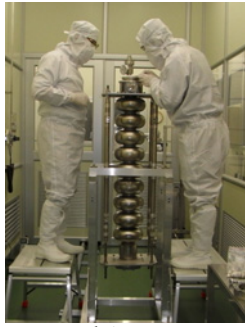
図3：試作した9セル空洞のアセンブリ作業。